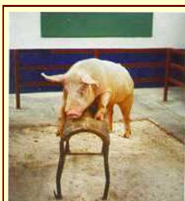
Figura 4. Verraco sobre maniquí para la recolección de semen.

En la extracción del material seminal se utiliza un potro o maniquí, forrado de piel de bovino por ser más resistente y durable, impregnado con secreciones vaginales de una hembra en celo o fracciones del semen de otros cerdos, lo cual produce un estímulo suficiente para aumentar la actividad sexual. Para realizar esta técnica es necesario un entrenamiento previo de los verracos al salto con el potro, siendo indispensable disponer de un lugar o sala de recolección donde el verraco no pueda distraerse y realizar la monta normalmente sin alteraciones de ruidos, olores o la vista de otros machos (figuras 4 y 5).