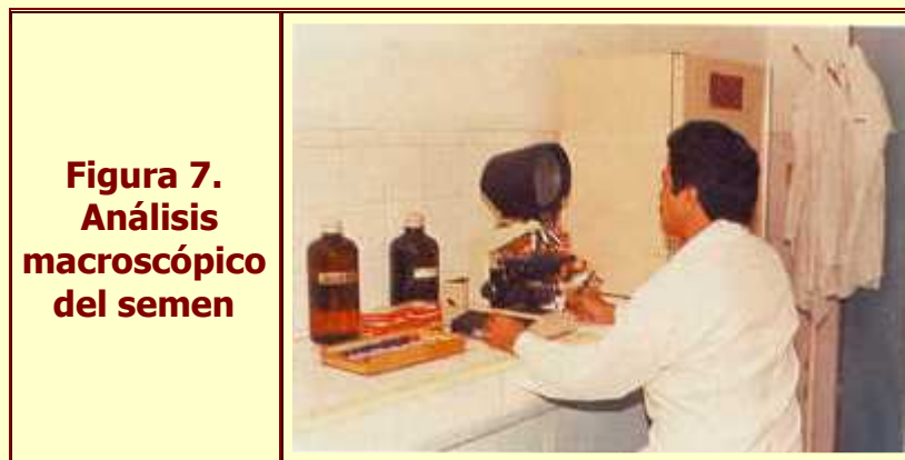
Figura 7. Análisis macroscópico del semen

Fuentes (1988) en Venezuela, encontró un mayor volumen durante los meses de más altas temperaturas, corroborando lo observado por Cameron ( 1985) en Australia, con promedio de 231,35 ml. Como componente extra del eyaculado, la fracción sólida (tapioca) presenta un volumen promedio de 32,45 ml.