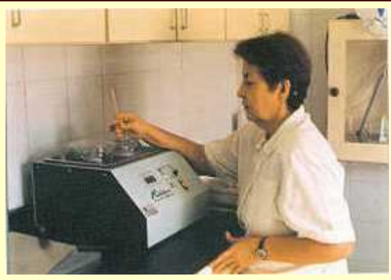
Figura 10. Igualar la temperatura del diluyente a la del semen.

Una vez diluido el semen con un volumen dado de diluyente y mezclado a igual temperatura, se distribuye en frasco-dosis o simplemente es colocado en un recipiente dosificador y se procede de inmediato a la IA de las hembras en celo. En términos generales, es recomendable utilizar para la IA sólo el eyaculado que presente las condiciones óptimas que garanticen alta eficiencia de la técnica.